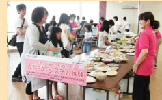
令和元年度食育推進イベント 応援団：沖縄県栄養士会さん