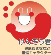
けんぞう君 健康おきなわ21 推進キャラクター