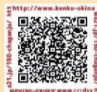
チャーガンジュー おきなわ応援団HP

沖縄県電子申請サービスでも申請できます。 手続き名に「チャーガンジューおきなわ応援団」と入力・検索下さい。