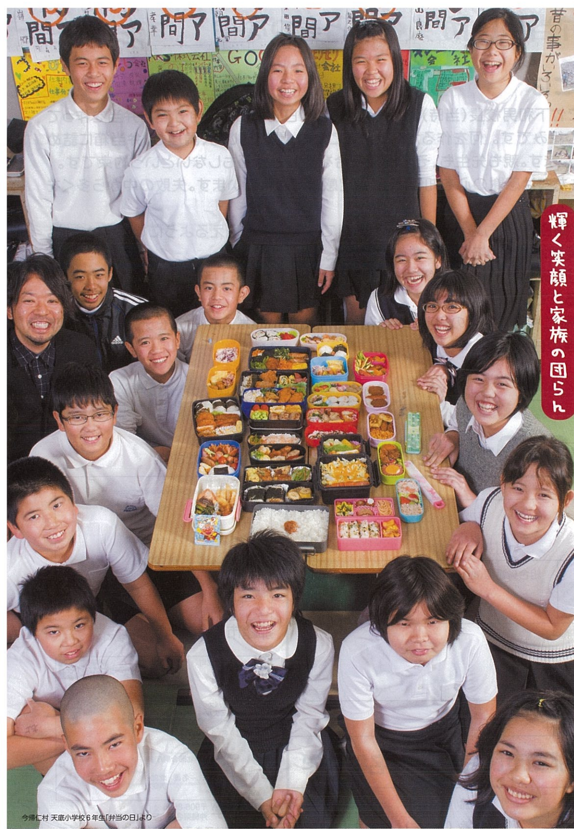
今帰仁村 天底小学校6年生「弁当の日」より