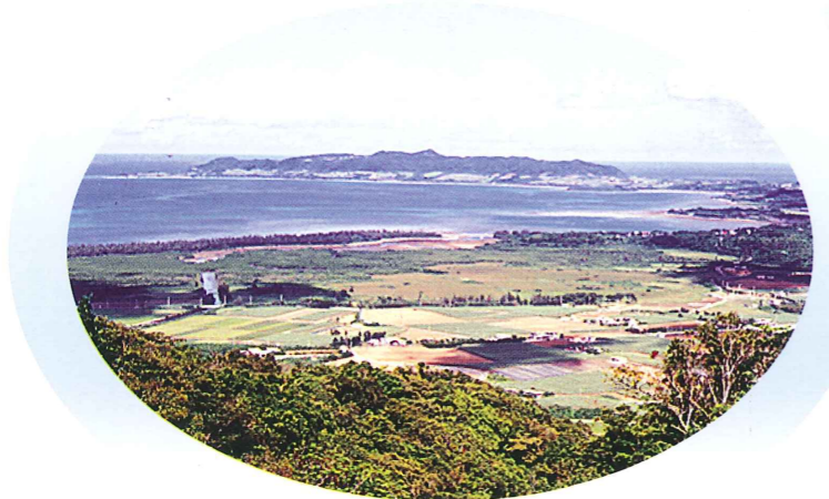
エメラルドの海を見る展望台より名蔵湾の眺望

森林散策広場各ポイント間の距離 1 400m 2 480m 3 410m 4 290m 5 北口 1.58km