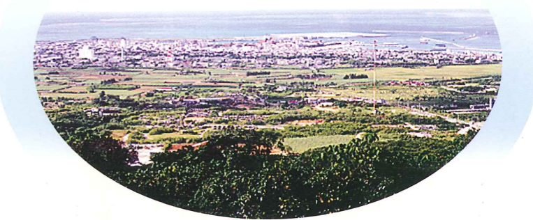
エメラルドの海を見る展望台より石垣市街地の眺望