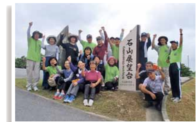
南城市からバスを借り受けて、年に1回実施している「やんばる健康ウォーク」