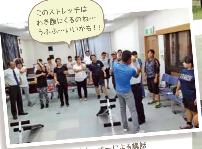
スポーツトレーナーによる講話