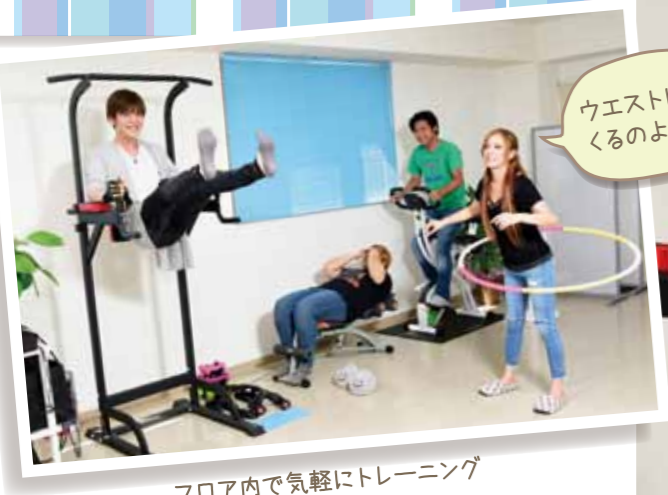
フロア内で気軽にトレーニング