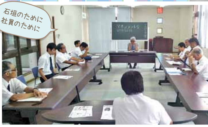
安全衛生委員会の様子