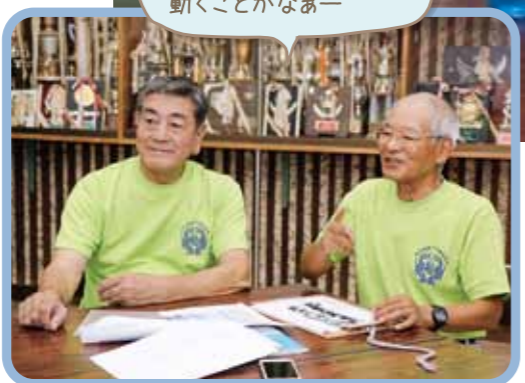
元気いっばいの知花局長(右)と金城区長(左)