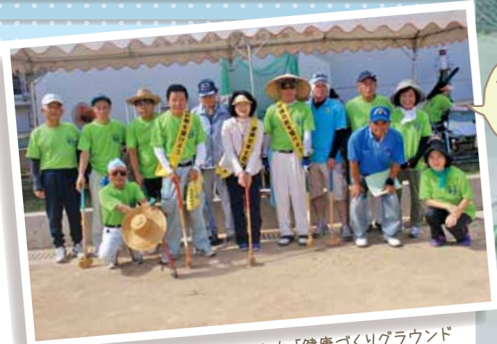
特定健診受診率の向上を目的とした「健康づくりグラウンドゴルフ大会」