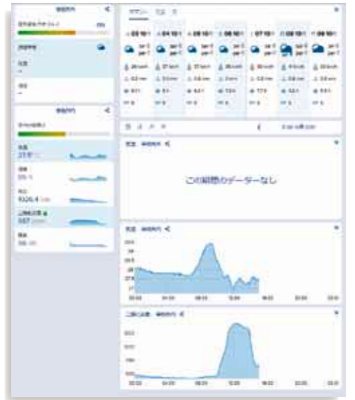
室内の気温・湿度・気圧・二酸化炭素・騒音をパソコン上で管理